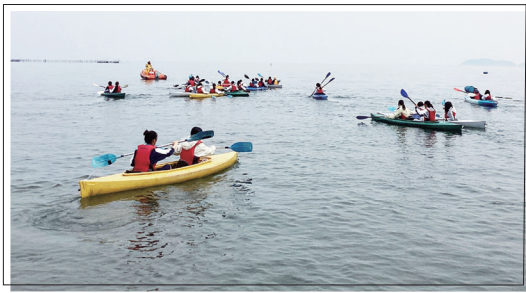
1年生校外学習 (4月10日) BSC ウォータースポーツセンター

— 純美禮 — 純美禮 ……純真な心で友情と連帯を深め合う ……美しい心と姿で環境を明るくする ……礼儀正しく、高校生としての秩序を守る