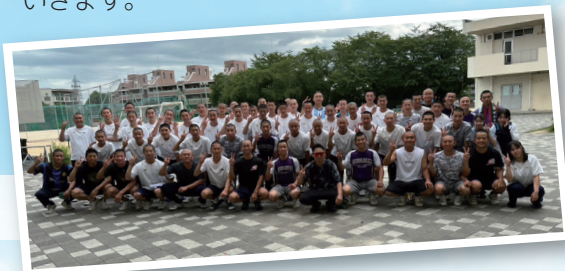
男子硬式野球部公式 Instagram

男子硬式野球部は3年生22名・2年生24名・1年生18名で活動を行っています。大会で勝って甲子園で活躍することが大きな目標ですが、目標に向かって3年間を過ごす中で自分の一生に生きる力を身につけていきたいと日々を過ごしています。また、この春に行われた第97回選抜高等学校野球大会ではたくさんの応援ありがとうございました！これからも、みんなに喜んでもらえるように頑張っていきます。