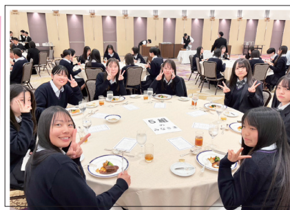
テーブルマナー講座 (4月14日)