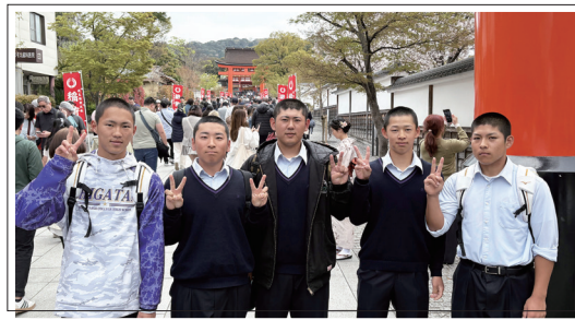
3年生Ⅰ類校外学習 (4月11日)