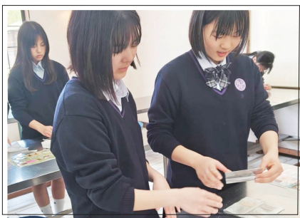
パンづくり体験 (4月11日)