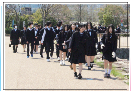
1年生校外学習 (4月14日) エコフォスター