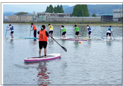
琵琶湖サップ体験 (5月20日)