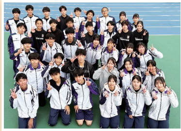
陸上競技部公式 Instagram: sumire_trackandfield

陸上競技を通して、感謝の気持ちを忘れずに、仲間とともに成長し、挨拶やマナーなどの規範意識を身につけ、学業と部活動の両立を目指しています。