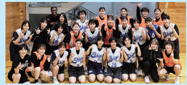
新潟強化遠征 (GW) にて、新潟アルビレックスBB ラビッツ主催の強化試合に参加