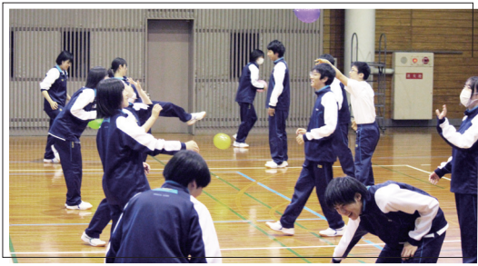
2・3年Ⅱ類勉強合宿 (4月9日~11日)