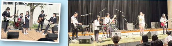
第17回 滋賀県軽音楽クラブ対抗コンテスト出演